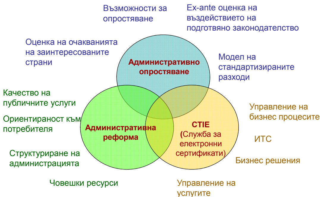
графика 3. Е-управление – междуинституционално сътрудничество

Програмата на правителството за предоставяне на услуги „едно гише“ от 2010 г. вече включва и предлагането на услуги не само за бизнеса, но и за гражданите. Предоставят се 53 услуги, свързани с прилагането на данъчното законодателство и 255 услуги, свързани с различни аспекти на транспорта, гражданството, образованието, жилищното законодателство и услугите за семействата. Общият информационен портал за on-line услуги има 1,5 милиона посещения годишно, още преди да предоставя услуги извън бизнеса.